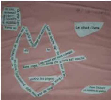
Avec des étiquettes mots